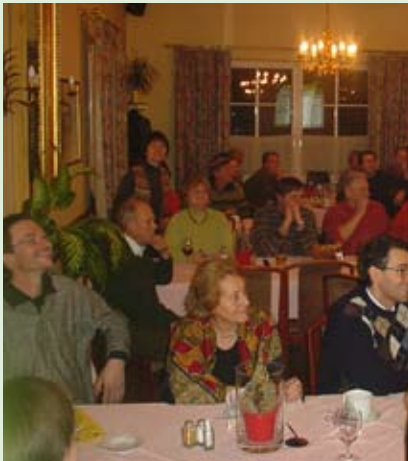
Gut besuchter Energie-Infoabend