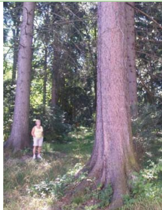
Baumriesen auf dem Sanatoriumsgelände

Die von der Wiener Privatklinik eingereichte und im Kurier vom 20. 1. 2009 angepriesene „Stadt der Senioren“ in Pressbaum wird keineswegs diesem Bedarf gerecht und wird deshalb von der Bürgerinitiative abgelehnt. Die in 8 Wohntürmen geplanten Eigentumswohnungen bis zu