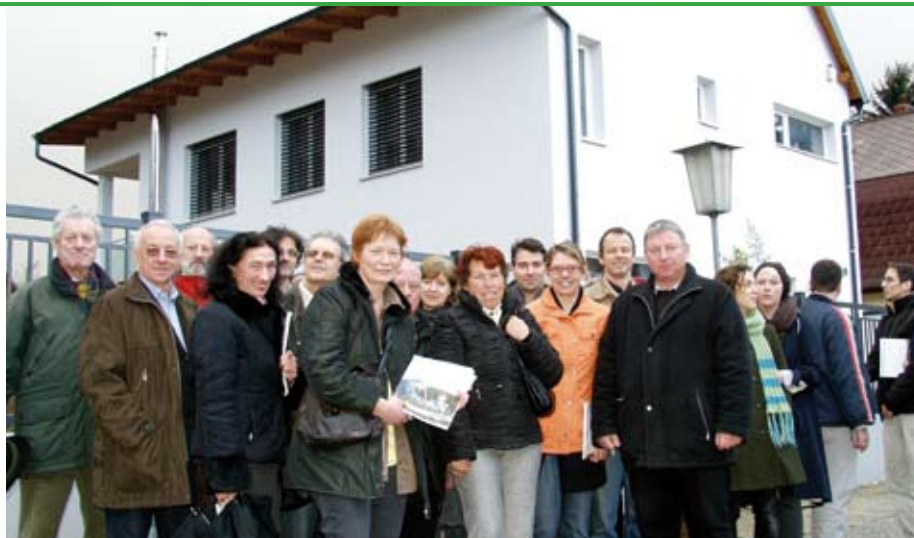
Die TeilnehmerInnen vor einem Passivhaus in Purkersdorf

Doch egal, ob neu gebaut, oder Altes saniert werden soll, viele Fragen wollen vorher geklärt werden. Dürfen bei einem Passivhaus keine Fenster mehr geöffnet werden? Wird es denn wirklich warm im Winter? Oder: Wie viel Einsparung ist durch eine energetische Althausanierung realistisch möglich?